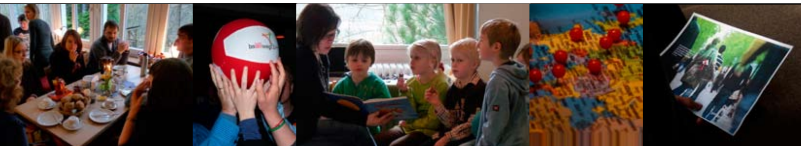
Bilder oben: Köttingen 2011

Allen Mitgliedern, Leserinnen und Lesern wünschen wir eine erfahrungsreiche Passions-/Fastenzeit und ein frohes Osterfest!